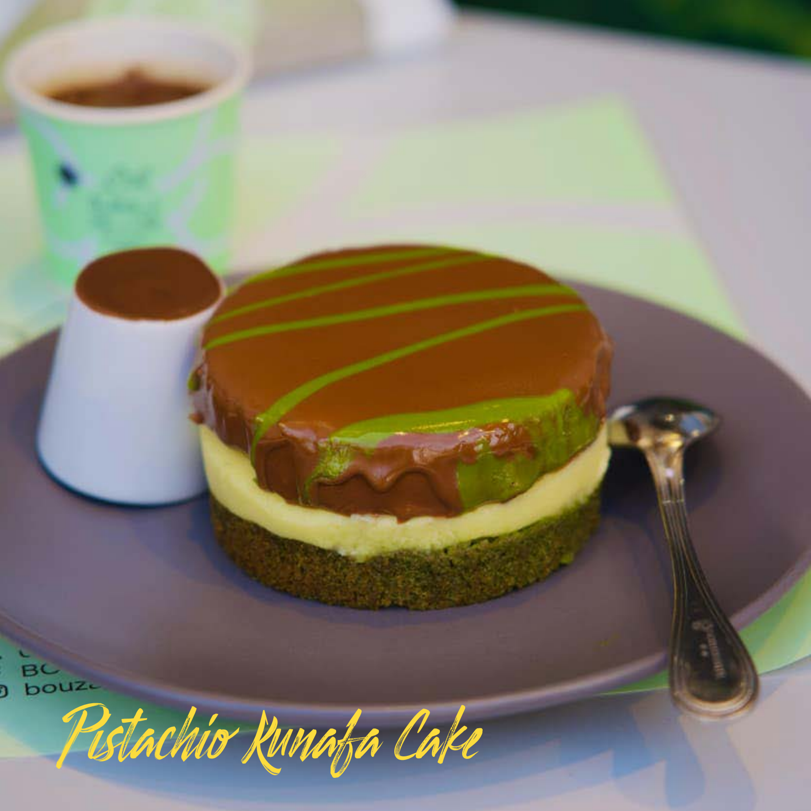
Pistachio Kunafa Cake