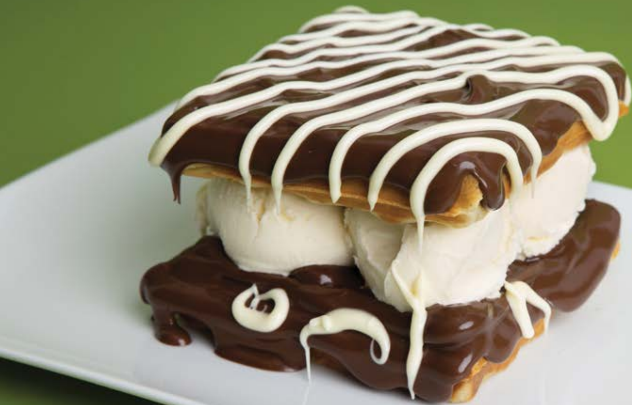
Chocolaten Waffle Tower