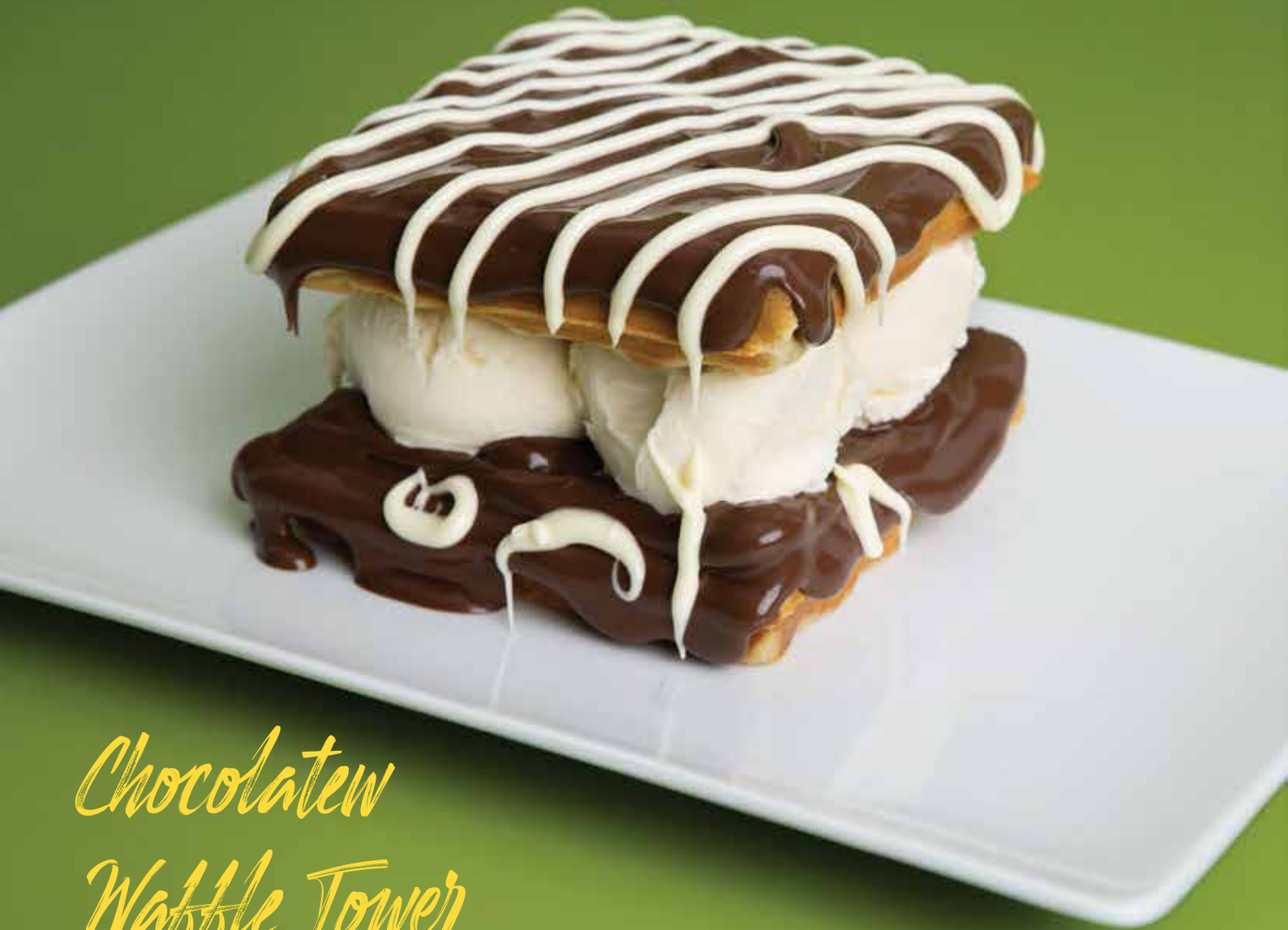
Chocolate Waffle Tower